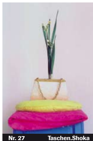
Nr. 27 Taschen.Shoka