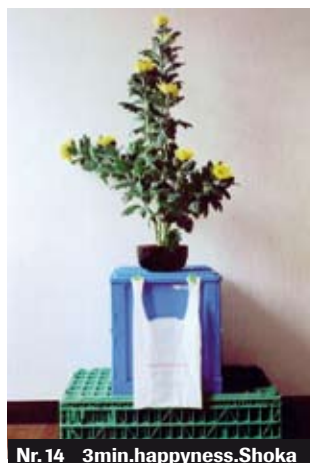
Nr. 14 3min.happyness.Shoka